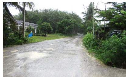
เส้นทางเข้า-ออกด้านหน้าพื้นที่โครงการ