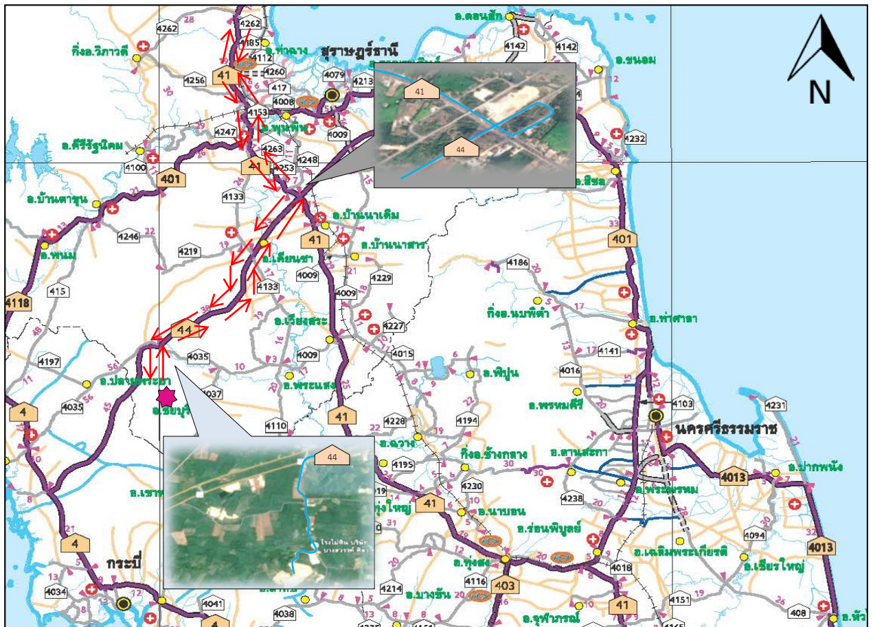
รูปที่ 1-3 แสดงการคมนาคมเข้าสู่พื้นที่โครงการ