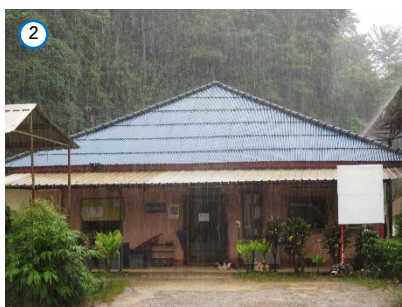
สำนักงานของโครงการ