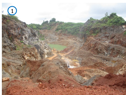
พื้นที่หน้าเหมือง