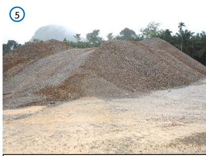
พื้นที่ลานกองแร่