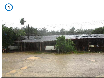
บ้านพักพนักงาน