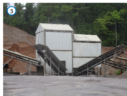
โรงโม่หินของโครงการ