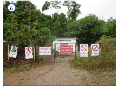
สถานที่เก็บวัตถุระเบิด