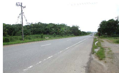
ทางหลวงหมายเลข 44